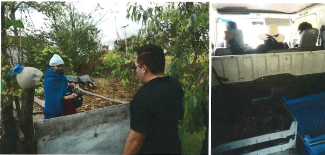
Foto: Entrega de viandas

Nuestra visión de apoyo a los sectores más vulnerables se basa en que la prioridad debe ser siempre el ser humano, como centro de toda gestión de política pública, colocándolo por encima de cualquier bien material, para lograr un objetivo que es fundamental: devolverles la felicidad a las personas, hacer de Sidcay una parroquia que valore a sus adultos mayores.