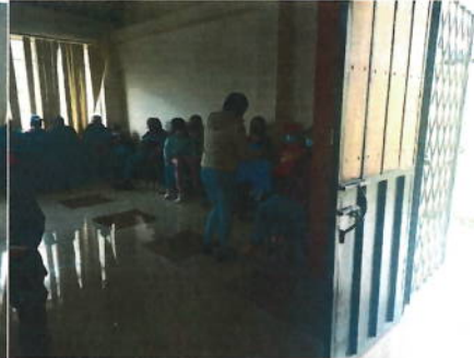
Capacitación en manejo de frutales con varios sectores de la parroquia entre ellos: Puyo Zhumir, Guavizhun, Cristo Rey, San Vicente, Bibín, San José, L Caldera, etc.